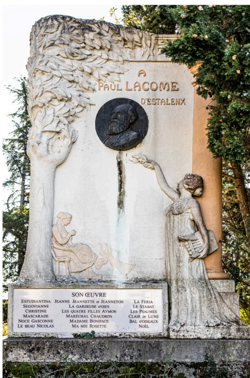
Monument actuel au Houga