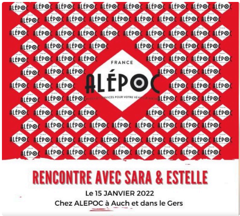
4l trp alepoc.JPG