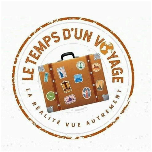
le temps d1voyage (002).jpg