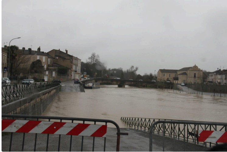
Que peut-on craindre de cette nouvelle montée des eaux ?

À Condom, la dernière montée des eaux s'est produite le samedi 11 décembre 2021, à 22 heures, la Baïse affichait alors au plus fort 2,11 m.