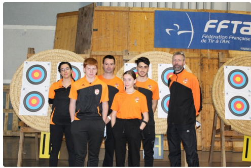
Photo groupe découvertes et leur entraîneur Auch 02 01 2022.JPG