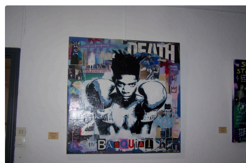
Round 2 Boxe

L'exposition est visible au Golf Las Martines à l'Isle-Jourdain, jusqu'à fin février.,