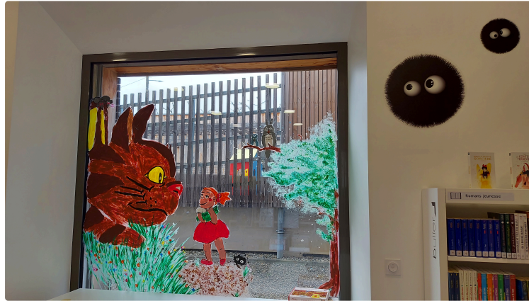
La légende du cinéma d'animation, Hayao Miyakazi, à l'honneur cette année à la Médiathèque

Dès que l'on pénètre dans l'espace « jeunesse » de la médiathèque, le ton est donné !