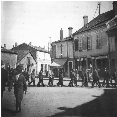
Traversée de la Patte d'Oie, Auch – Cliché Oscar Lafontan 1923

Le passe sanitaire sera exigé à l'entrée pour le bien être de chacun.