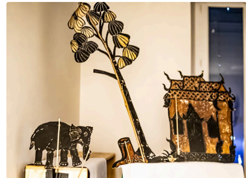
Ensemble de marionnettes "de situation" 1bis 060122.jpg