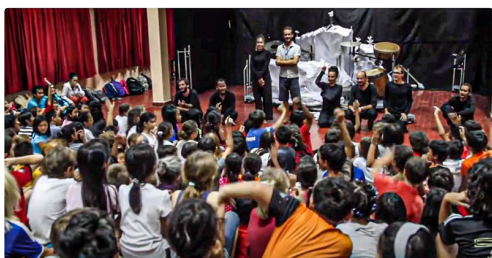
Extrait de "Un Œil une oreille" (vidéo Youtube)