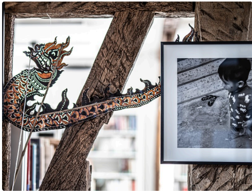
Marionnette de dragon et photo d'enfant