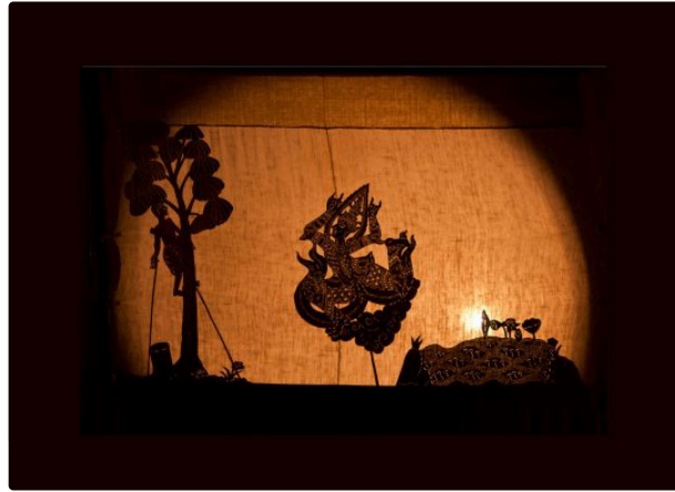
Marionnettes du Cambodge au Houga

La Compagnie l'Aurore, jeune compagnie théâtrale créée en 2001, est basée à La Réole (Gironde). Elle est venue en résidence artistique dans le territoire de la Communauté de communes du Bas-Armagnac (CCBA).