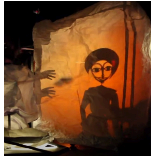
Extrait de la vidéo indiquée (Youtube "Un Œil une oreille" à Phnom-Penh)