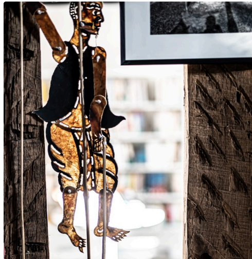
11 Marionnette d'homme