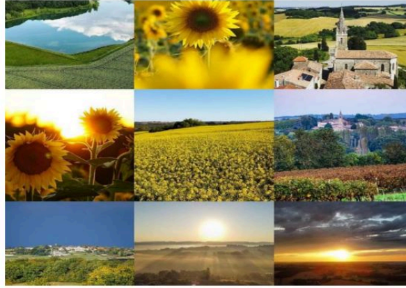
Les Gersois performants sur Instagram d'après l'Observatoire Social Media des territoires

Bien que, cette fois, le Gers soit dépassé par l'Ariège tandis que la Communauté de Communes de la Ténarèze a grimpé d'une place