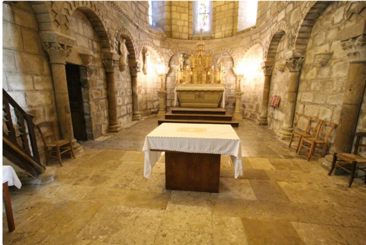
Le vœu de tous les Mouchanais et de leur maire, Christian Touhé-Rumeau

Une inscription sur la liste des sites reconnus au Patrimoine mondial de l'UNESCO