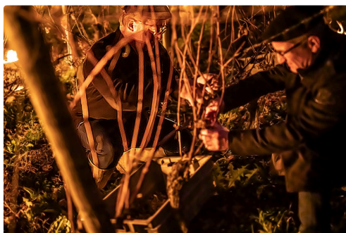
Cueilleurs au travail