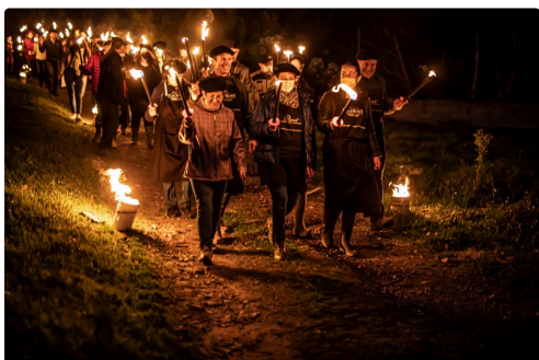
Retour sur l'arrivée du cortège