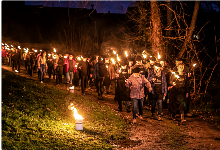
Vendanges du Pacherenc de la Saint-Sylvestre « quand même » à Viella