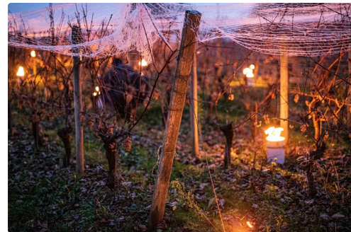
La vigne est prête...