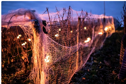
Les raisins sous filets protecteurs