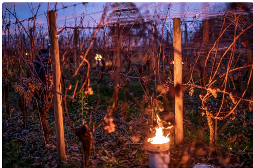
...elle attend les cueilleurs