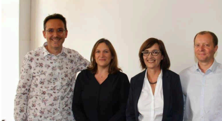
L'opposition au maire de Condom existe bel et bien

... et elle entend le prouver, notamment par le biais de ce communiqué adressé à l'ensemble des Condomois