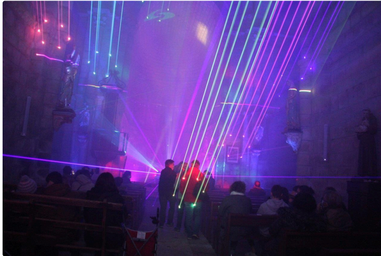
C'est beau une église illuminée, la nuit !

Pari réussi, les spectateurs étaient au rendez-vous en cette veille de Noël.