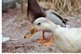
Influenza aviaire : le mal se répand

Grippe aviaire le mal se répand dans le Sud-Ouest.