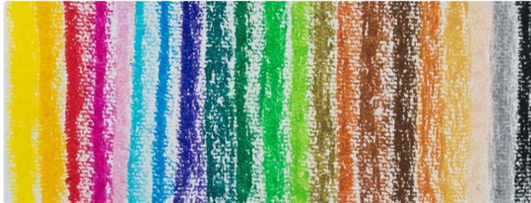
Un dernier atelier avant la fermeture annuelle