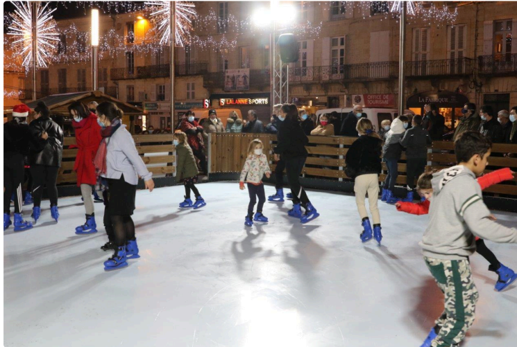
Lâcher prise, une recommandation du maire de Condom pour ces fêtes de Noël