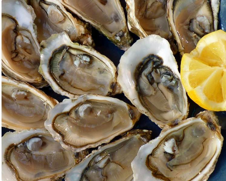
Quand le boucher devient écailler