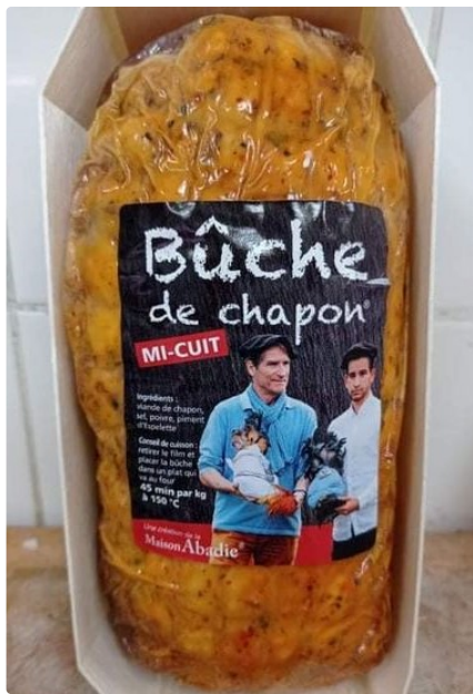
Buche de chapon.jpg