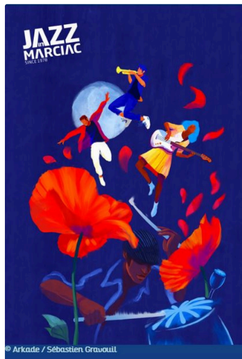
jazz marciac affiche 2022.JPG

D'ici-là, toute l'équipe de Jazz in Marciac vous souhaite de bonnes fêtes.