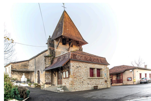
Eglise à Lelin-Lapujolle, avec la mairie au rez-de-chaussée ; à droite, la salle des fêtes