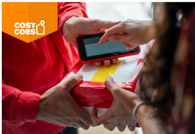
Souvent à la maison ? Devenez voisin relais !

Cosy Colis va vous permettre de rendre service à vos voisins