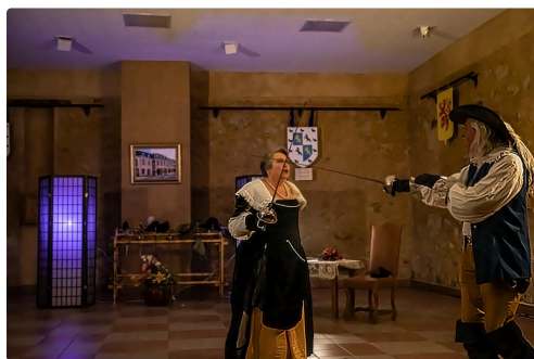
Scène de ménage qui tourne au duel

Voir l'article sur les autres animations du marché de Noël ( https://lejournaldugers.fr/article/53965-lupiac-le-marche-de-noel-a-ete-loccasion-de-nombreuses-festivites ).