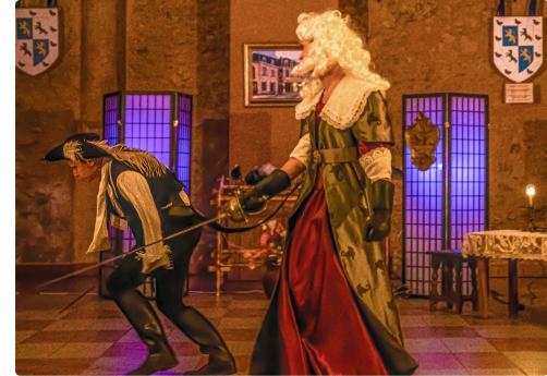
Il a osé défier le fameux chevalier d'Eon