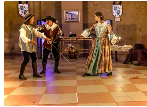
Un homme remplace la débutante