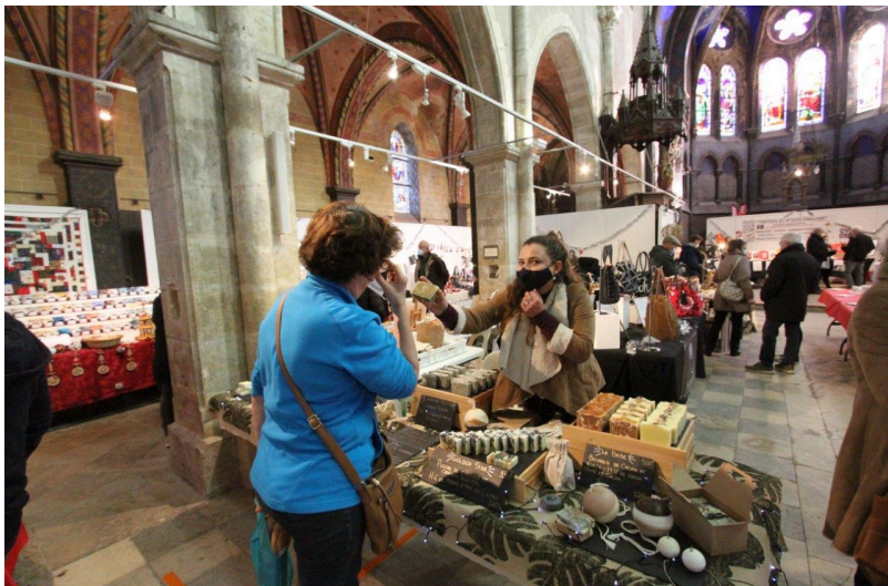
De l'artisanat d'art, mais aussi des associations caritatives, comme La Croix-Rouge française, par exemple.