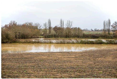
Champ inondé à Fustérouau