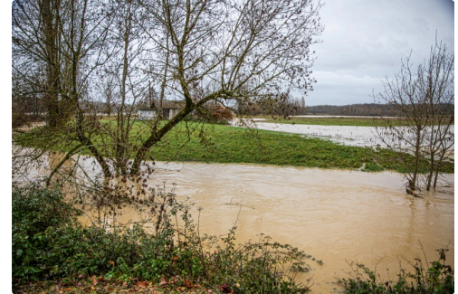
Paysage inondé à Fustérouau 1bis 101221.jpg