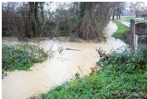
Le Midour vu d'un pont

N.B. - Sur la photo du haut de page : route coupée vers Bouzon.