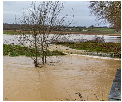
Cascade sous un pont de la Ribérette