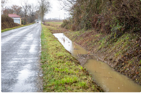
Un fossé très plein entre Nogaro et Sorbets