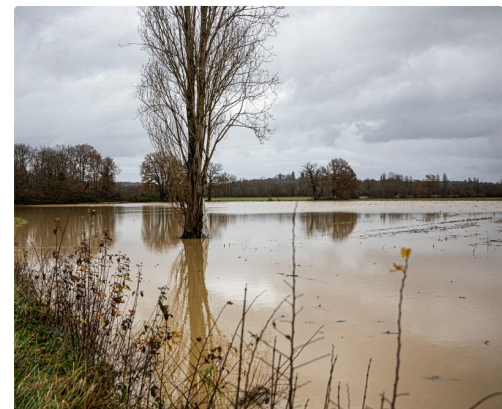
Champ inondé entre Aignan et Termes-d'Armagnac