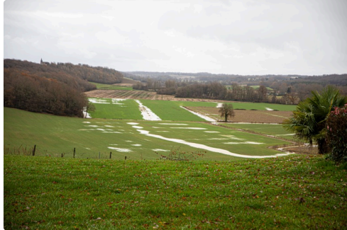
Etang en formation entre Bouzon et Fustérouau