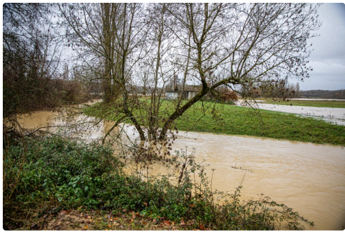
La Ribérette s'étale