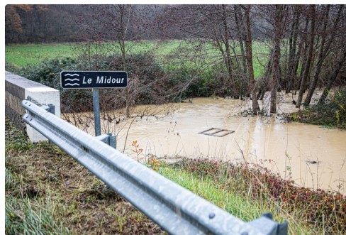
Le Midour vu d'un autre pont