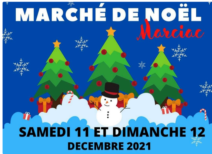
Noël grand format