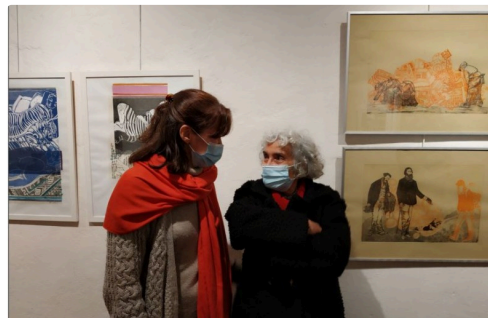
exposition à la galerie l'âne bleu