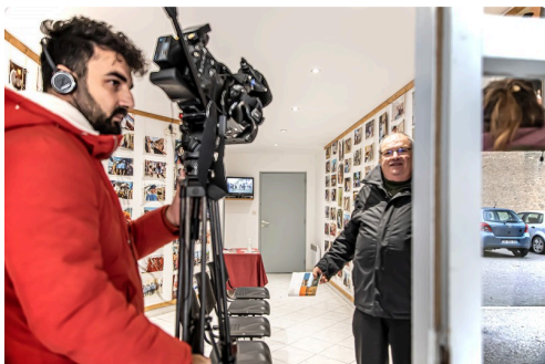
Dans le local de l'association