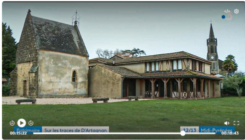
Ex-Chapelle Notre-Dame de la Pitié