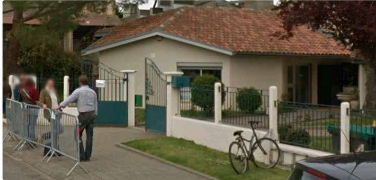
COVID 19 : Deux précautions valent mieux qu'une

Le collège réagit face aux risques d'aggravation