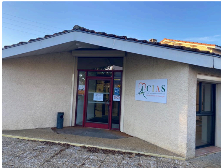
CIAS et Services techniques déménagent