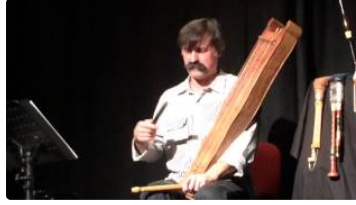
Contes de Noël au Musée d'art campanaire de l'Isle-Jourdain

Contes bilingües en musica per Marc Castanet