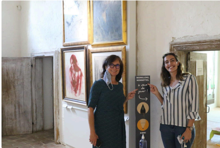
Suivez les guides !

Pour venir inaugurer "Moinillons et Nonnettes : à vous de jouer !", nouvel espace ludique à destination du jeune public