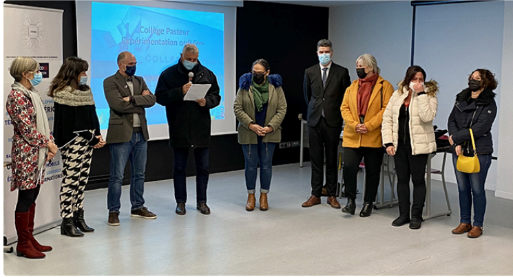
44 ordinateurs pour les élèves de 6ème du collège de Plaisance

Une expérimentation du conseil départemental