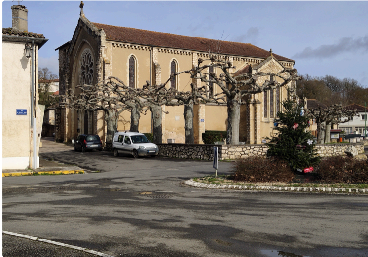
La tournée de Noël de Philippe Canelon

Trois étapes dans des églises gersoises pour son spectacle "Noël Enchanté"