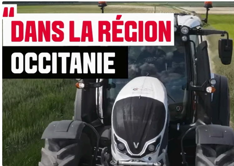
Le "Tour de France de l'innovation agricole en tracteur" fait une étape dans le Gers

Cinquième étape du CoFarming Tour organisé par l'association #CoFarming