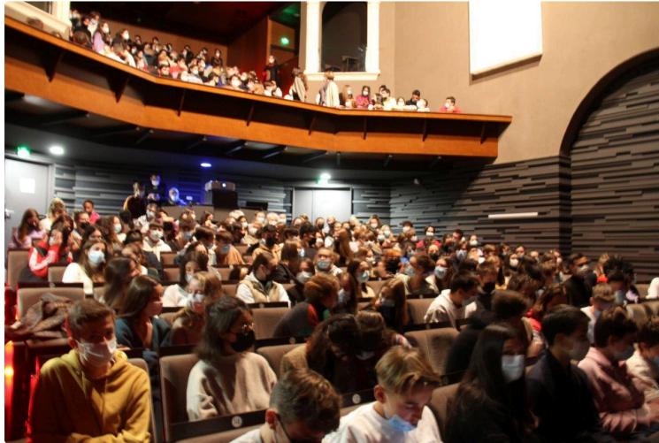
Trois arts qui dialoguent sur les chemins de la mémoire...

Salle comble au Théâtre des Carmes pour une projection spéciale réservée aux scolaires