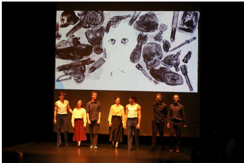
La troupe au grand complet.