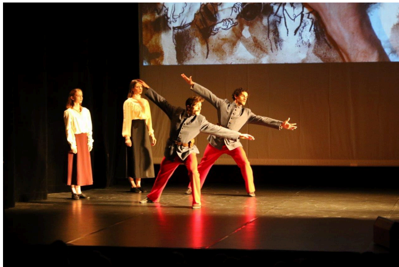
L'expression artistique permet ici de renouveler le regard porté sur la période de la Grande Guerre et l'Histoire nourrit également ce spectacle.