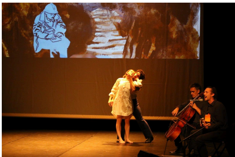
Les mélodies d'Antoine Trouillard vont s'incruster dans la tête du spectateur.