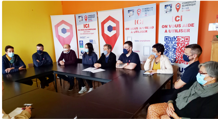
Gers numérique à la rescousse de l'illectronisme

Quatre conseillers numériques France Service sont déployés dans tout le département pour aider les personnes dans l'incapacité d'utiliser les outils numériques