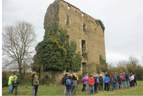
Rencontres et découvertes à Callian

Rencontres et découvertes, c'était la marque de la balade à Callian proposée par l'Office de tourisme d'Artagnan en Fezensac dimanche dernier.