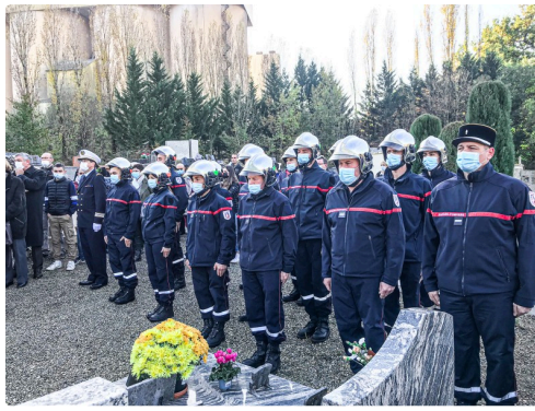
Le dispositif des sapeurs-pompiers au Carré militaire