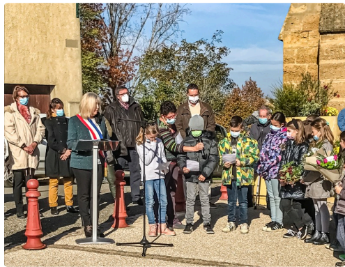
Au monument au mort, les enfants lisent des textes