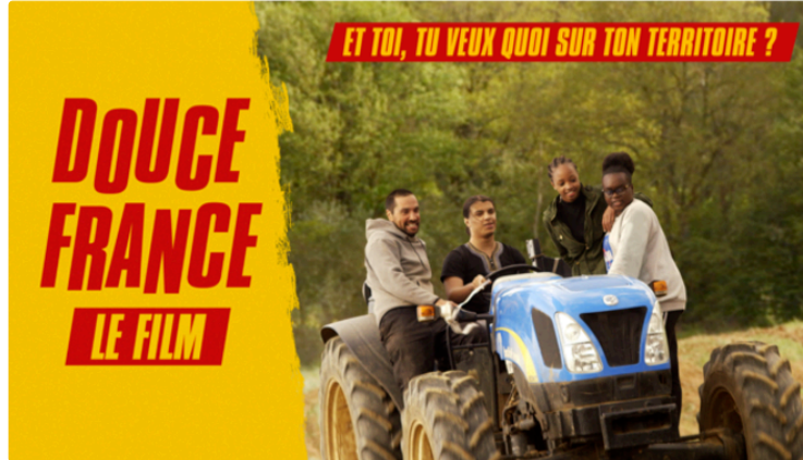
La projection du film "Douce France" dans le cadre d'un ciné-débat

... et comme toutes les semaines, la programmation détaillée du Gascogne