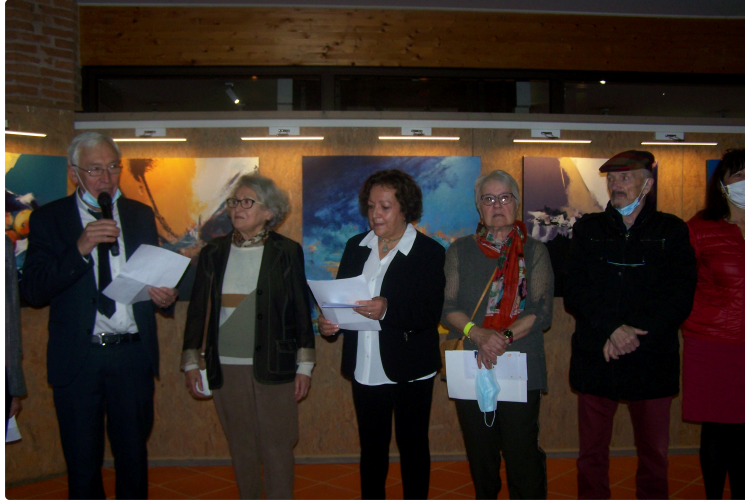
Retour artistique des "Muses d'Europe" au Musée Campanaire

Après un moment d'absence, dû au Covid, les portes de l'Art ont été ouvertes ce samedi au Musée Campanaire, avec un week-end bien chargé par la Fête de la Saint-Martin, Beaucoup de monde déambulait dans les rues de la ville, mais aussi une belle présence du public et des invités, au vernissage des Muses.