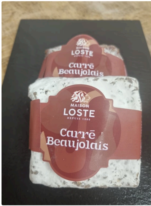
Beaujolais 2021 3.jpg