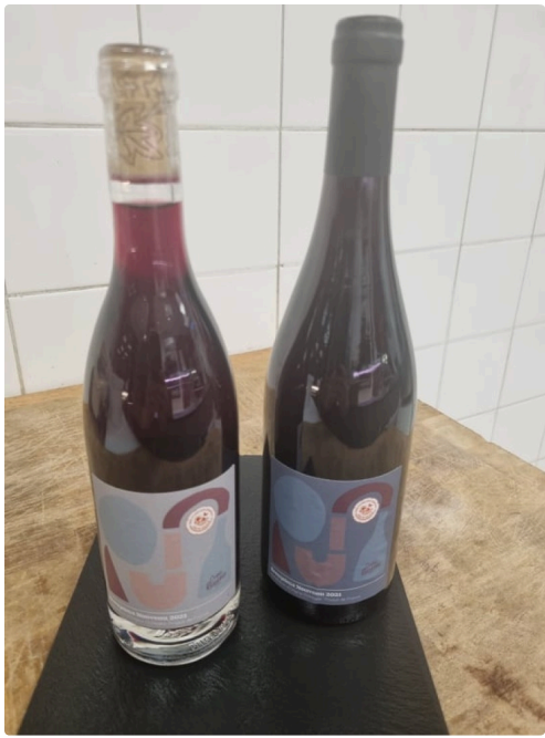
Beaujolais 2021 2.jpg