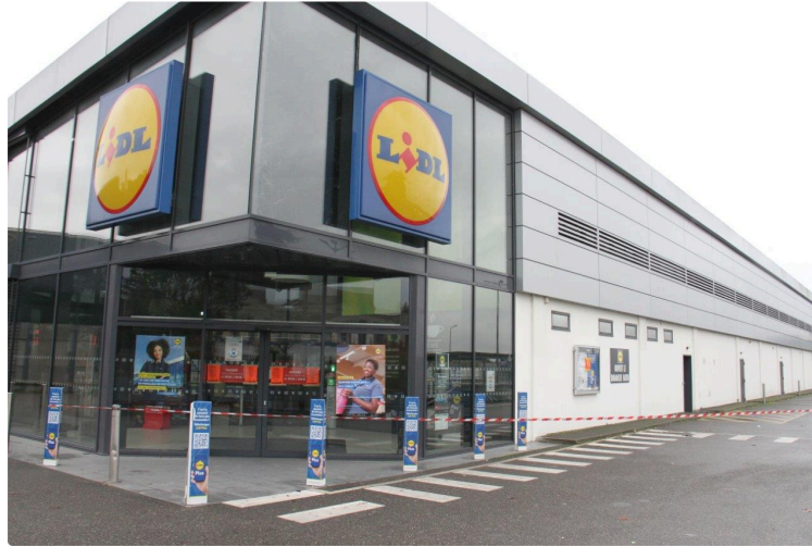
Portes closes au magasin Lidl

Mais que s'est-il passé à Condom dans ce bâtiment comme neuf ?