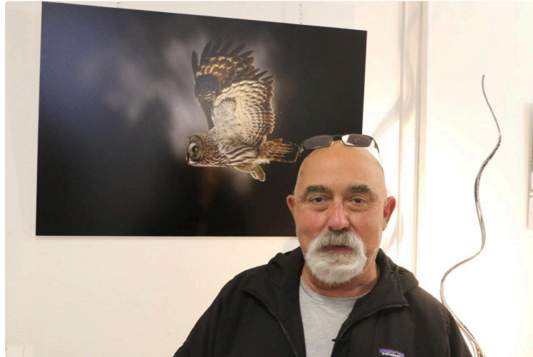
De retour de chez lui, en Finlande