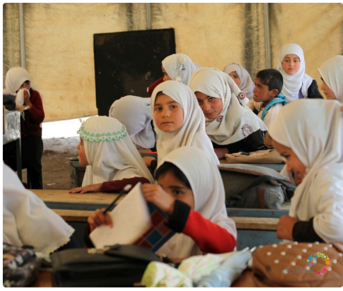
Photo d'après un prospectus de l'association Afghanistan libre