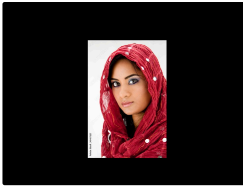
DR Adobe femme afghane 1bis.jpg