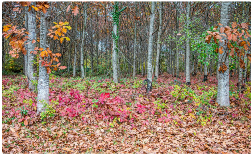
Chênes à Sorbets