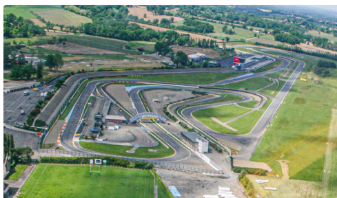
Vue aérienne du circuit (en rouge, la tour)