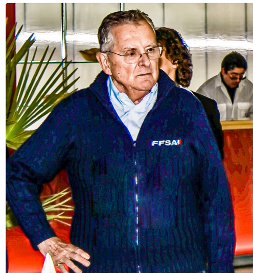
André Diviès en 2009