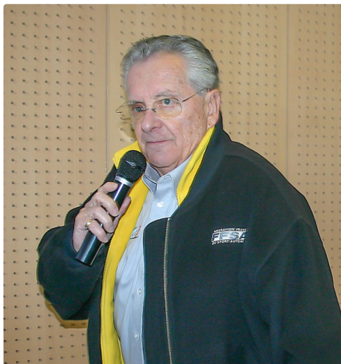
André Diviès en 2007