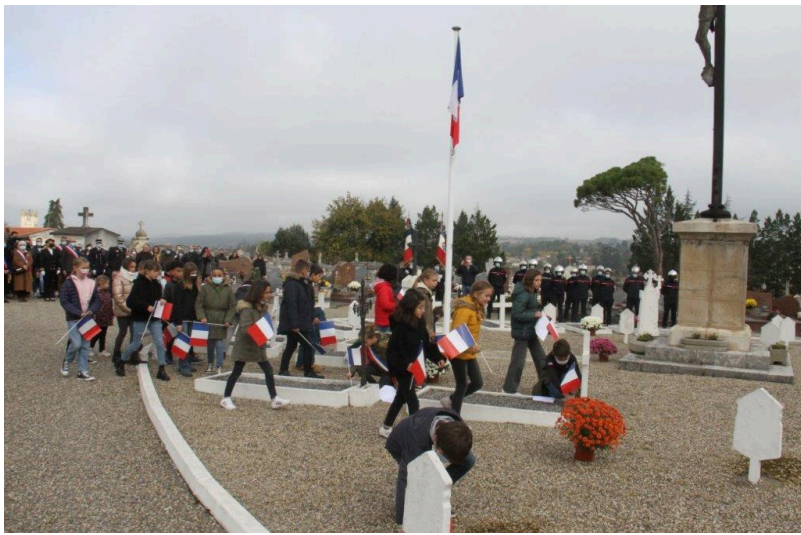
Dernières minutes de recueillement...