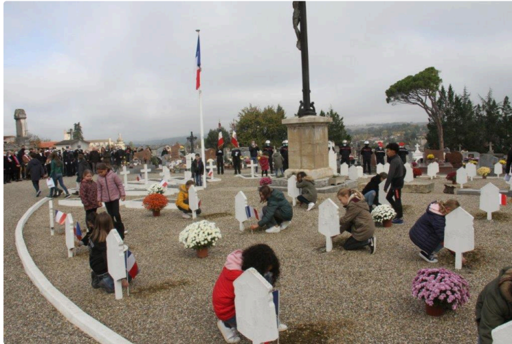
Un peuple qui oublie son passé, n'a pas d'avenir

Les événements peuvent sembler lointains avec des témoins directs de plus en plus rares.