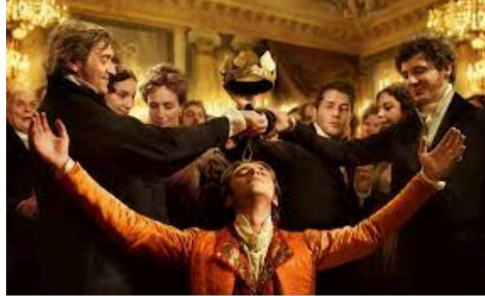
"Illusions perdues" au cinéma vendredi soir

Vendredi soir, à 21h, Illusions perdues de Xavier Giannoli avec Benjamin Voisin, Cécile de France, Vincent Lacoste ( 2 h 30 )