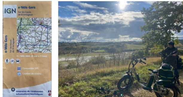
Ils ont testé la partie Gers de la route européenne d'Artagnan!

Premier itinéraire de randonnée équestre européen, la Route Européenne d'Artagnan relie Lupiac a qui a vu naître le héros légendaire, à Maastricht aux Pays-Bas, lieu de sa mort.