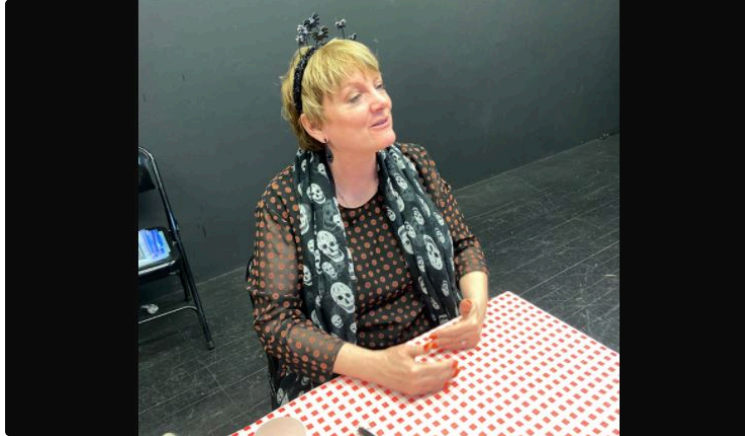
Les années sont passées, mais la série n'a perdu son "look" unique !