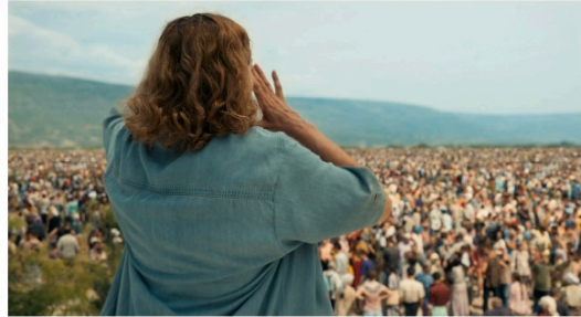
"La voix d'Aïda" au cinéma mardi soir...

Un drame mardi soir à 21 h La voix d'Aïda de Jasmila Zbanic ( 1 h 44 ) VO