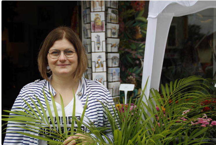
Noël et solidarité.

Boîtes de Noël au profit des personnes hébergées à la résidence Lagrange.