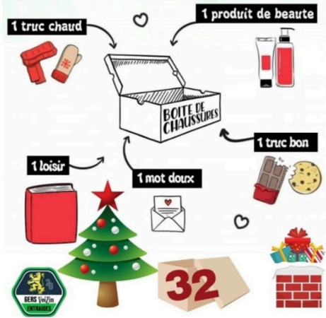
Noel et soloidarité 2021 (2).jpg